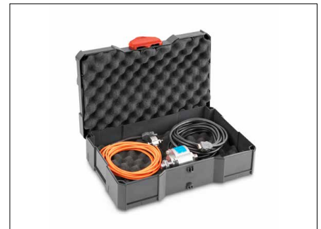
Tipp: Bestellen Sie den praktischen System-Koffer (systainer® T-LOC) zum Lagern und Transportieren von Zubehör, Klemmen, Sensoren, etc. gleich mit dazu, SAUTER FS TKZ, siehe Zubehör