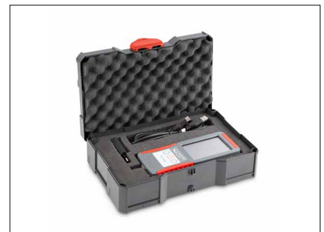
Lieferung im hochwertigen und robusten System-Koffer (systainer® T-LOC) inklusive Steckernetzteil und USB-Kabel Typ C