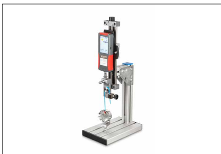
Montierbar an alle SAUTER Prüfstände, Abbildung zeigt optionales Zubehör, sowie den manuellen Prüfstand SAUTER TVL-XS

Das Premium Kraftmessgerät SAUTER FS ist mit allen SAUTER Dehnungsmessstreifen-Messzellen kompatibel, siehe Messzellen . Es können bis zu 4 externe Messzellen gleichzeitig angeschlossen werden.