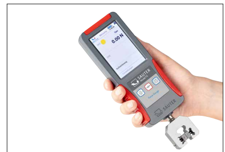
Kompaktes Kraftmessgerät mit interner Messzelle (bis max. 500 N) für schnelle und mobile Kraftmessungen. Abbildung zeigt optionales Zubehör Schraubspannklemme SAUTER AE 500