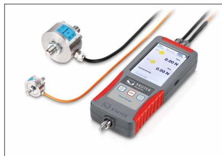
Gleichzeitiges Messen auf bis zu vier Kanälen. Externe Sensoren mit Sensordatenspeicher optional erhältlich, siehe Kapitel Messzellen