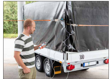
Messen von Kräften in verschiedenen Zug- oder Druckrichtungen mit nur einem Messgerät möglich